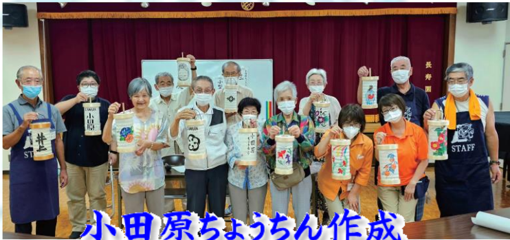
小田原ちょうちゃん作成