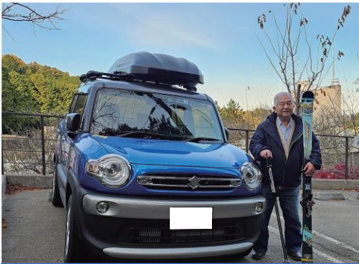
愛車と愛用のスキー板で

という事で、長寿園での生活に不満や困った事はなく、入居してからの方が安心して充実した生活を送っている。感謝・感謝です。